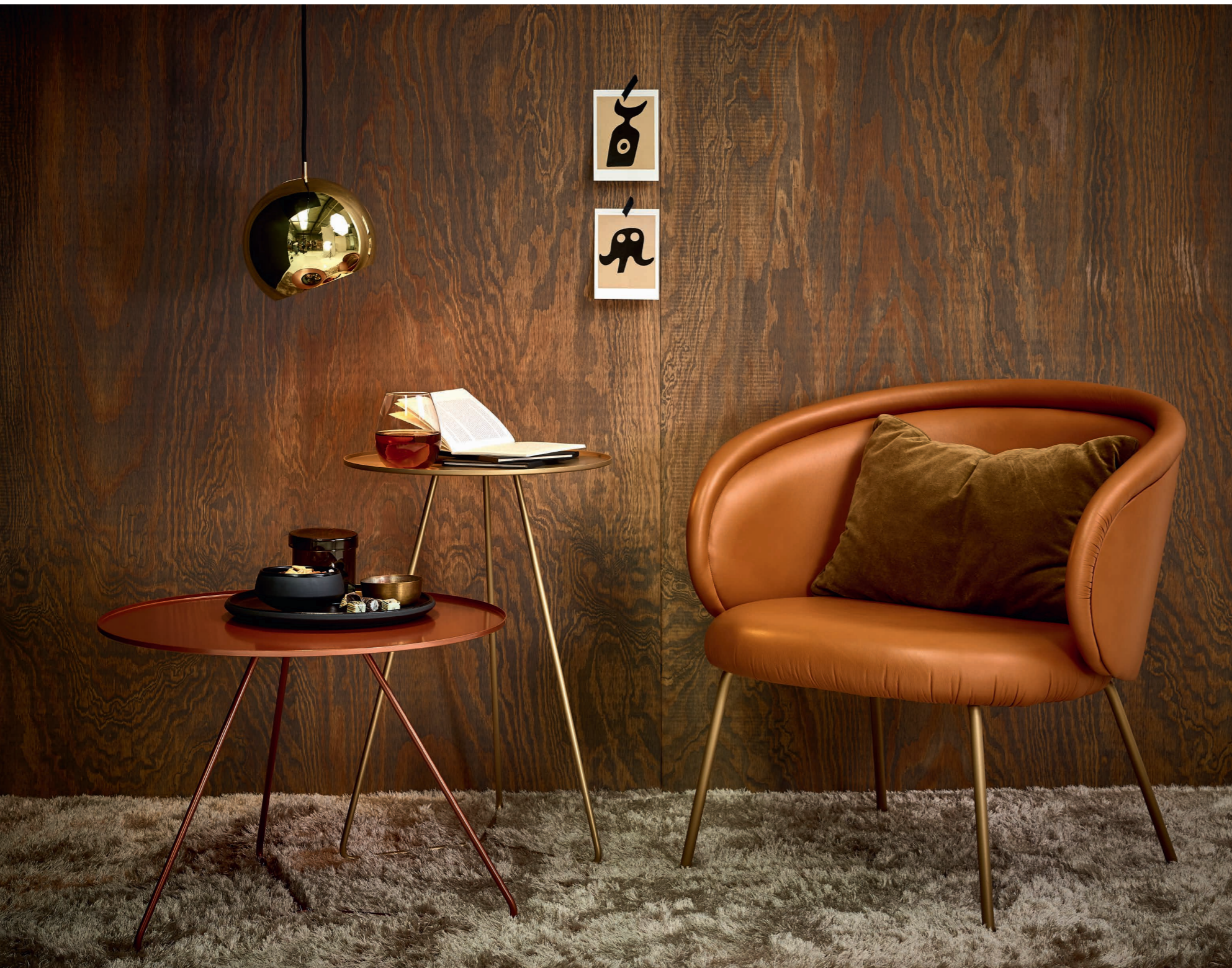
STEELY diam 55 cm, H 42 cm, in Bronze metallic STEELY diam 40 cm, H 60 cm, in Gold metallic

Eine Serie von filigranen, runden Beistelltischen aus Metall für den Wohn- und Schlafbereich. Ausführungen in vier Farben lackiert.